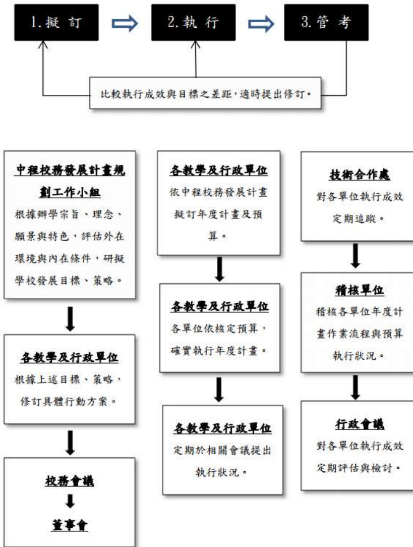
圖2—校級組織分工與運作圖